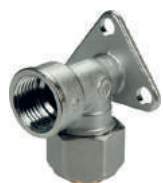
R572AM Угольник установочный с внутренней резьбой