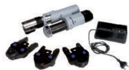
RP200-1 Комплект пресс-инструмента, аккумуляторный