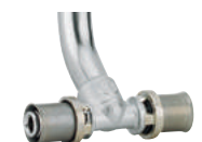
RM158 Тройник с трубой медной хромированной l=300 мм