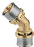
RM144 Угольник 45°