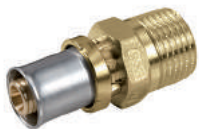
RM107 Муфта с наружной резьбой