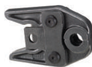
RP202 Пресс-клещи, профиль ТН