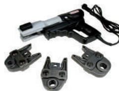
RP200 Комплект пресс-инструмента, 220 Вт