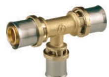
RM151 Тройник переходной