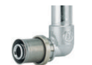
RM128 Угольник с трубой медной хромированной l=300 мм