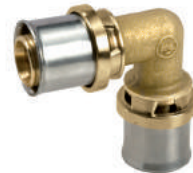
RM122 Угольник 90°