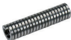
PR208 Пружина для изгибания трубы