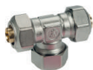
R565AM Тройник переходной