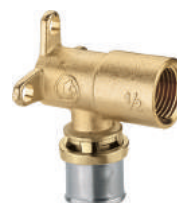
RM139 Угольник установочный с внутренней резьбой