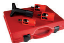
RP209R Калибратор/очиститель для металлополимерных труб