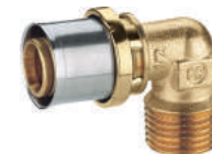
RM127 Угольник с наружной резьбой